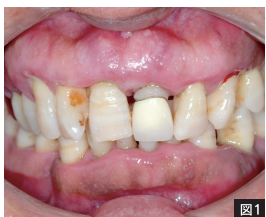
▲奥様から「口が臭い」といわれて2006年に当院に来院された患者様。重症の歯周病であった。歯周病を治して口臭はしなくなり、現在も定期的な歯科メンテナンスを継続。口臭の悩みから完全に開放されている。

朝起きた直後の生理的口臭やニンニクなどの臭いのある食材を食べた後の口臭は、時間が経つと消えていきます。しかし、病気やばい菌に起因する病的口臭は、原因を退治しないと消えません。鼻や喉、胃腸が悪いと口臭が強くなると言われており、糖尿病や腎臓病、肝臓病でも口臭が気になる